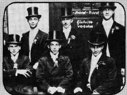
„Der Vorsitzende der Kirmesgesellschaft hat ausdrücklich betont, daß er heute kei- nen Besuch empfängt.“ Vorstand der Kirmesburschen