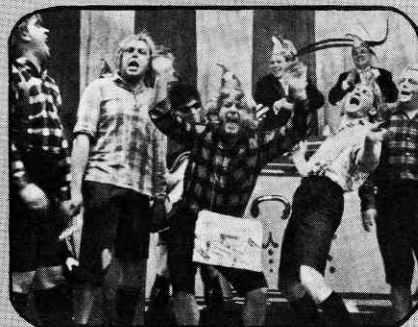
„Haben wir nicht schon immer dafür plä- diert, aus dem Mendelssohnhaus eine Musikhochschule zu machen?“ Horchheimer Doppelquartett im Karneval