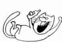
Doorn katz ereumie