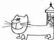
Pla katz äule