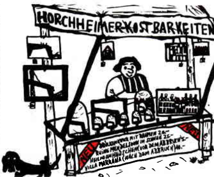
Hier Souvenirs: Brückensturz, Mendelssohn im Schnee, Heiligenhäuschen, Markana...