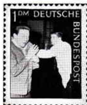
Wohlfahrtsmarke: Kontakte zum Heer