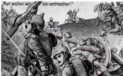
Parole Kirmes! Auf Jungs, nach Horchheim!