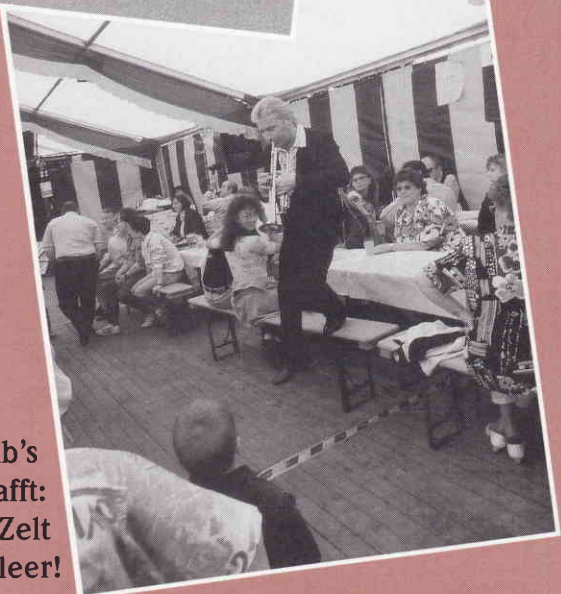
Ich hab's geschafft: das Zelt wird leer!