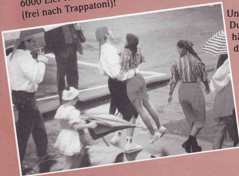
Und Du hältst durch!!!