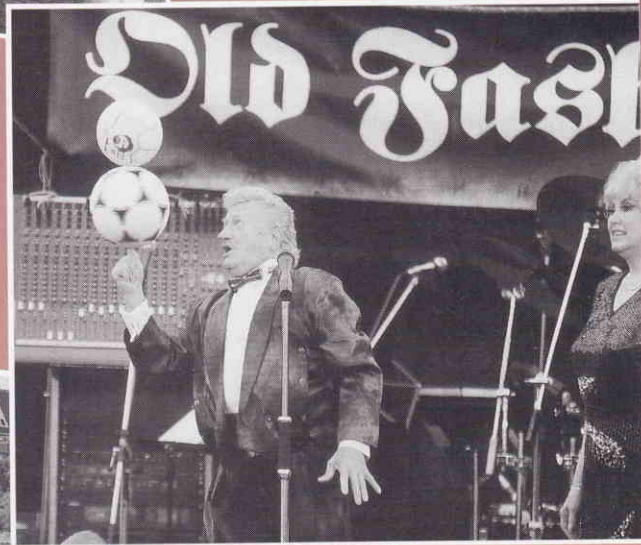
Wenn Kirmes es trara, dann hält hier groß und kla!