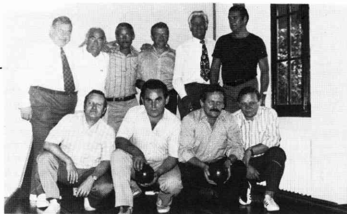
Für die Kegelbrüder vom „Falschen Eck“ geht es nicht um Punkte und Siege, sondern um Spaß und Geselligkeit.

men der Kirmeszeitung sprengen, wollte man eine Bestandsaufnahme aller Horchheimer Clubs durchführen. Wohl jeder Kegelverein hat seine eigenen Erlebnisse und seine eigene Vereinsgeschichte, ob Sport- oder Gesellschaftskegler. Alle aber freuen sich auf ihren Kegelabend und haben Spaß am Spiel. ●