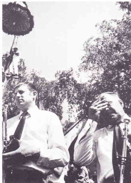
Mein Gott, seit 20 Jahren spiele ich hier, und jedes Jahr der selbe Witz.