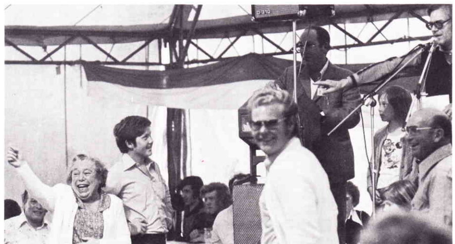
Der Verlierer des Hosenknopfes kann sich bei dieser Dame melden.