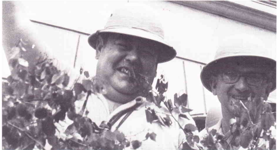
Die werden sich doch nicht trauen, als Bildunterzeile „Judy und Dactari“ zu schreiben!