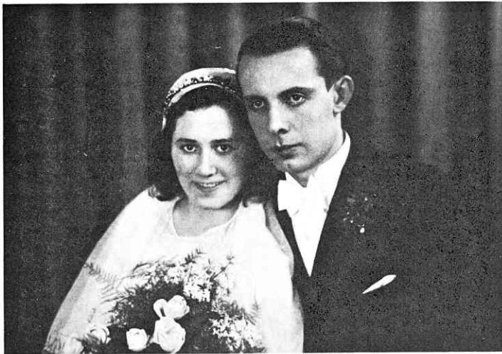
... und bei der Grünen Hochzeit