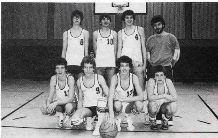
Hier die B-Jugend des Vereins.