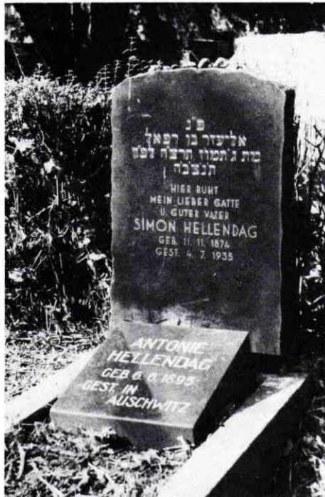
Grabstein der Familie Hellendag auf dem jüdischen Friedhof Koblenz