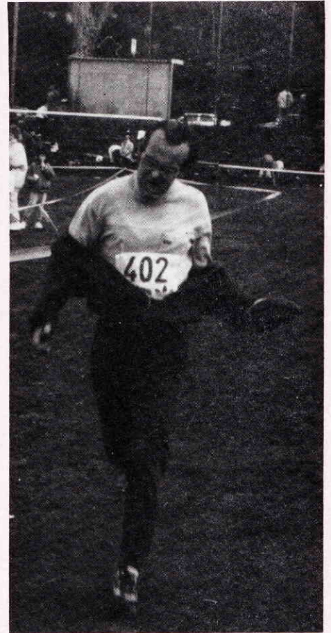
„Nur schnell weg hier! Ich hab nämlich bei der Verlosung den Kirmesbaum gewonnen!“