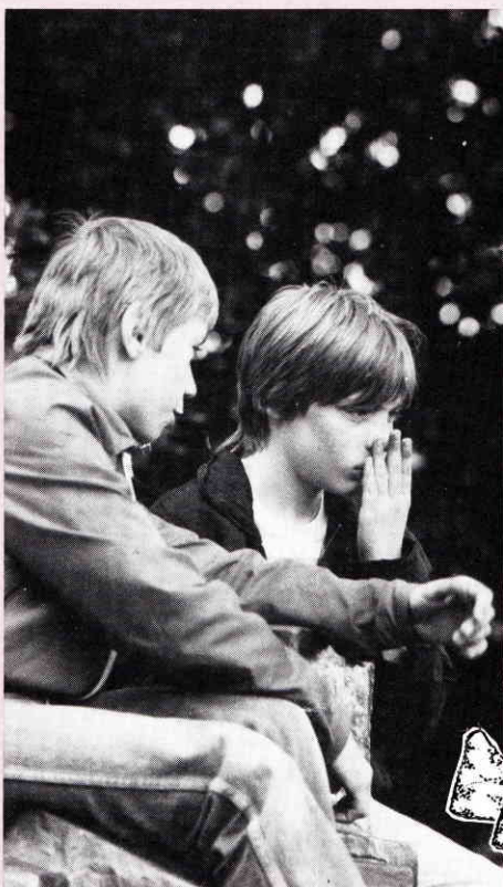
„Du kannst sagen, was Du willst – Hoschemer Käs stinkt penetrant!“