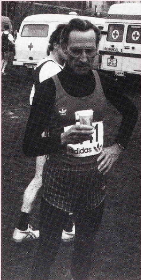
„Gott sei Dank – der Zaubertrank des Druiden Miraculix. Jetzt lauf ich genauso schnell wie Asterix!“