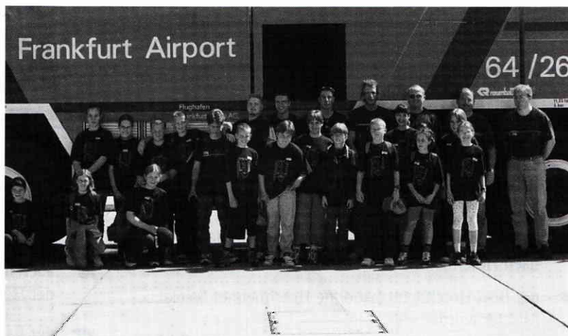
Tagesausflug der Jugendfeuerwehr zum Flughafen Frankfurt mit Besichtigung der Flughafenfeuerwehr.