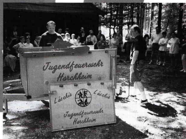
Löschia, der PKW-Anhänger, mit feuerwehrtechnischen Gerätschaften.