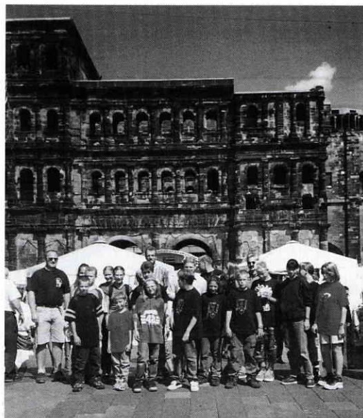
Station in Trier nach einem Wochenende in einer Jugendherberge in Bollendorf.

Mit ihren blauen Uniformen und roten Regenjacken sind sie schon von weitem bei jedem Auftritt im Orts-geschehen sichtbar. Die 9 Jungen und 9 Mädchen im Alter von 10 bis 16 Jahren der Jugendfeuerwehr Horchheim nutzen jede Gelegenheit, sich in der Öffentlichkeit darzustellen.