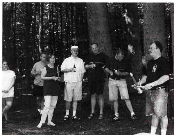
Taufe von Löschia.