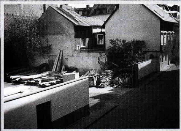
Situation im Jahr 2001

stammt aus dem Jahr 1966. Die Siedlung auf der Horchheimer Höhe war fertig, aber noch an das alte Kanalnetz der Alten Heerstraße angeschlossen. Bei jedem größeren Regenguss war dann „Land unter“ in Horchheim. Die von der Höhe herabstürzenden Wassermassen stauten sich an der Brücke Alte Heerstraße/Mendelssohnstraße in dem viel zu kleinen Kanalrohr der Brücke, so dass die Kanaldeckel fort flogen und die „Brühe“ in meterhohen Fontänen in den Bahnschacht bzw. die „Vehgass“ und von dort in den Ort floss.