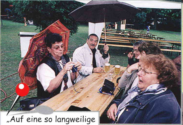
„Auf eine so langweilige Kirmes habe ich mich Gott sei Dank schon vorbereitet!“