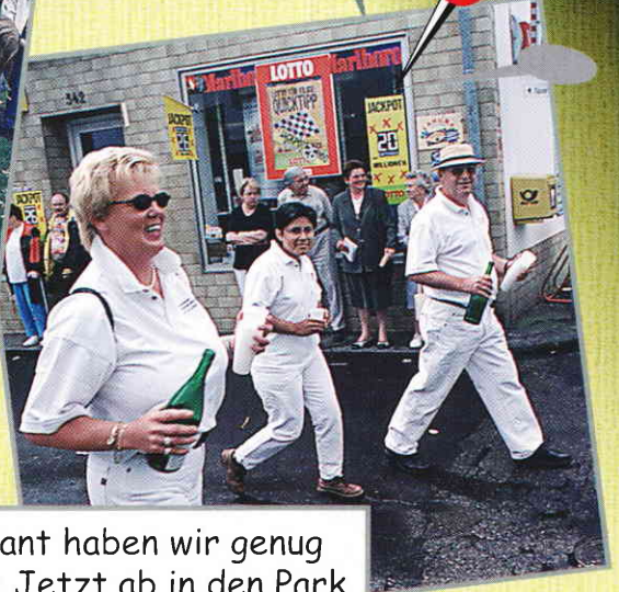
„Proviant haben wir genug dabei: Jetzt ab in den Park und dann wird gefeiert!“