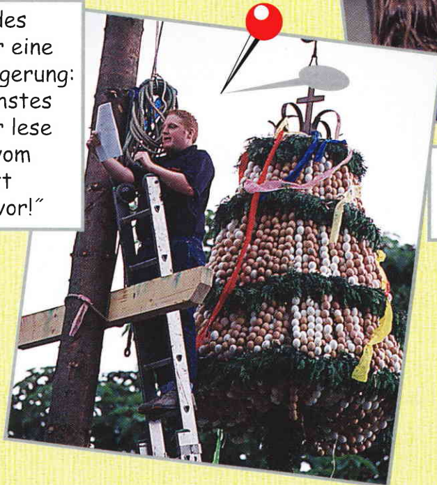
„Jedes Jahr eine Steigerung: Nächstes Jahr lese ich vom Brett aus vor!“