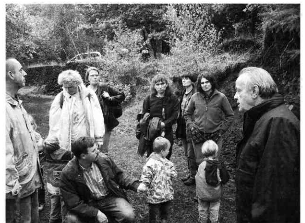
Führung im Vulkanpark in der Eifel