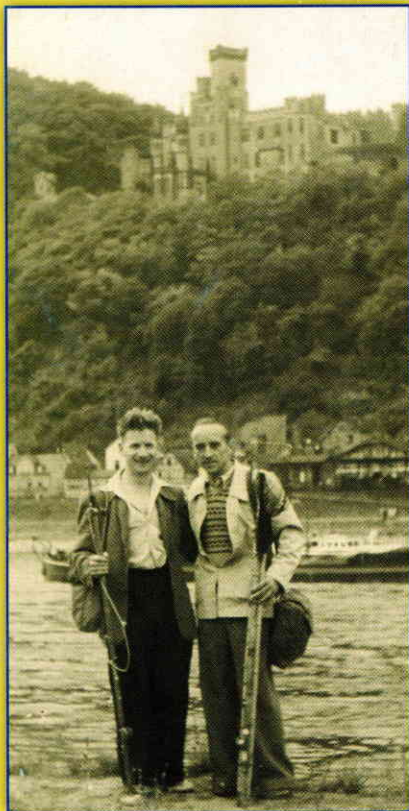
Eine Kaserne als Wartesaal