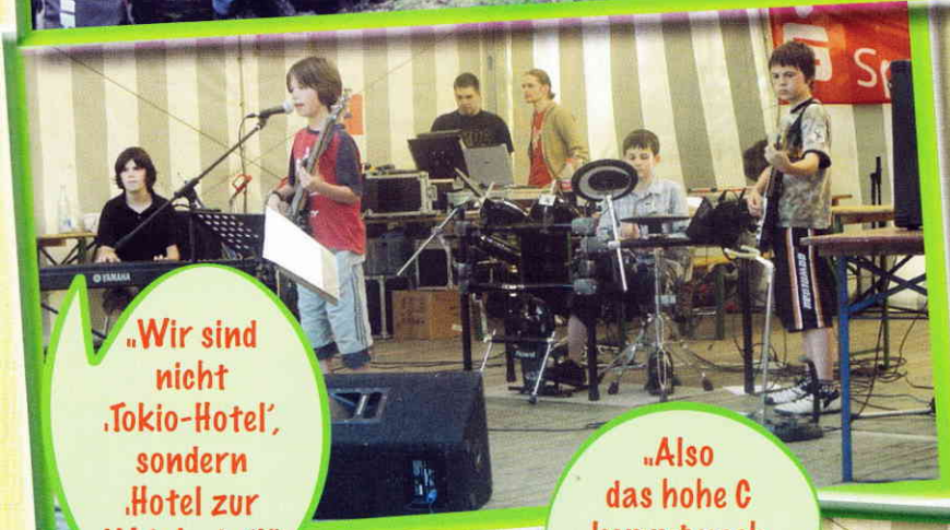
„Wir sind nicht ‚Tokio-Hotel‘, sondern ‚Hotel zur Weinlaube!‘“