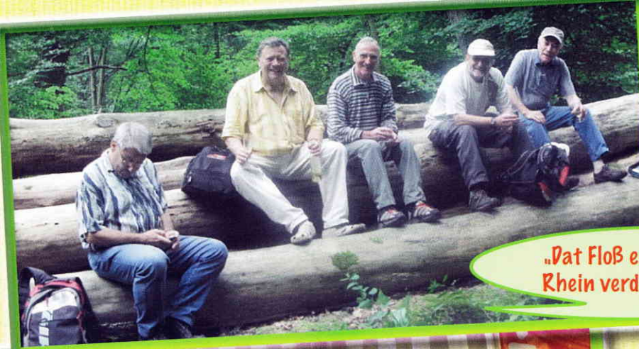
„Dat Floß es fertig, aber der Rhein verdammt weit weg!“