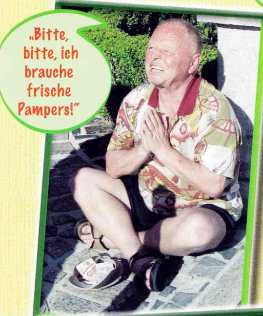
„Bitte, bitte, ich brauche frische Pampers!“