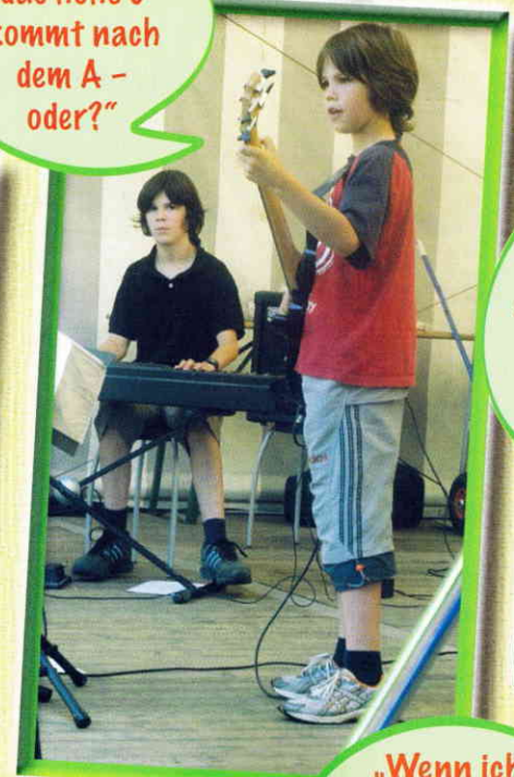
„Meine Schwester sagt immer, sie trifft dann besser!“