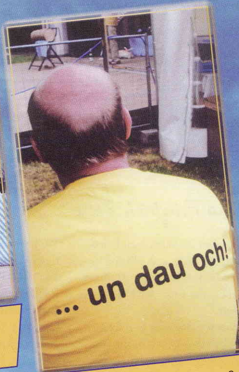
Ich han en Plät, on dau?