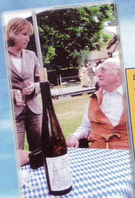
Sie müssen aber jetzt von der Jungen Union in die Senioren-Union wechseln ...