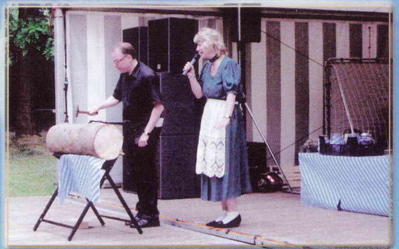
Hier sehen Sie einen echten "Schwarzarbeiter"