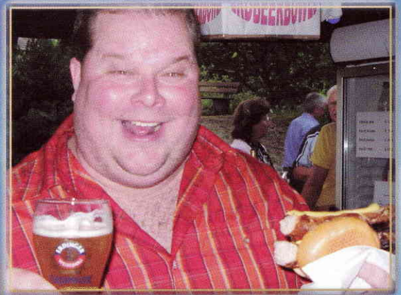
I like Diät!